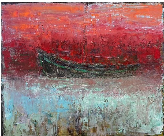
Olie maleri v. Kjeld Nielsen